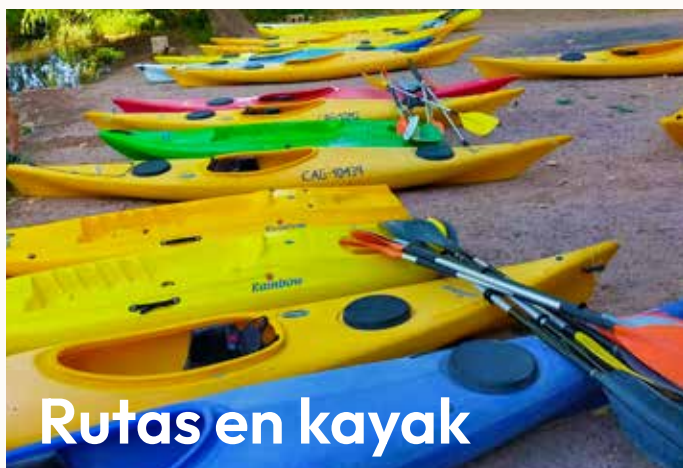
Rutas en kayak