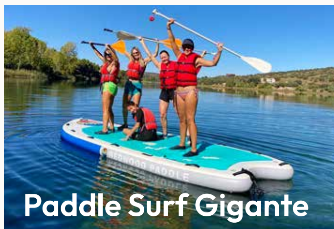
Paddle Surf Gigante